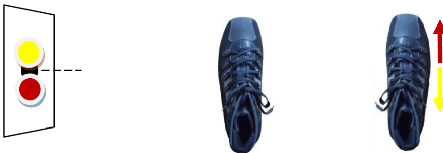
Feineinstellung Seite I*

Stehst du mit der Waffe aber schon in der Neun und dir fehlt nur ein ganz kleines Stück bis in die Mitte der Scheibe, dann ist dieses Steuerrad ungeeignet. Hier bedienst du dich deinem zweiten Steuerfuß.